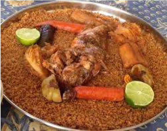
Mon plat préféré : le Tiep