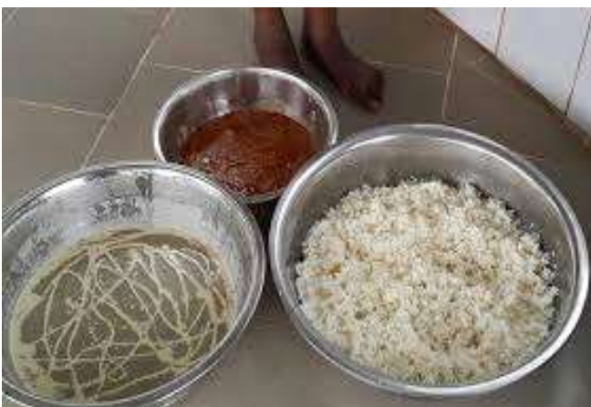
Monument de l'indépendance