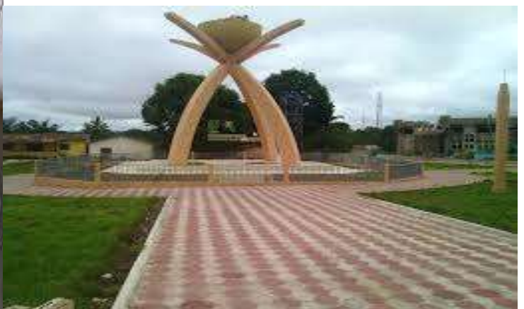
Riz et sauce