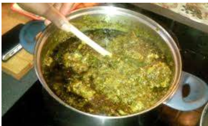
Un plat, leNgoudja