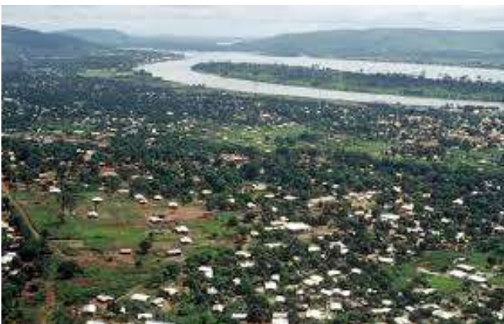
Bangui La rivière Oubangui