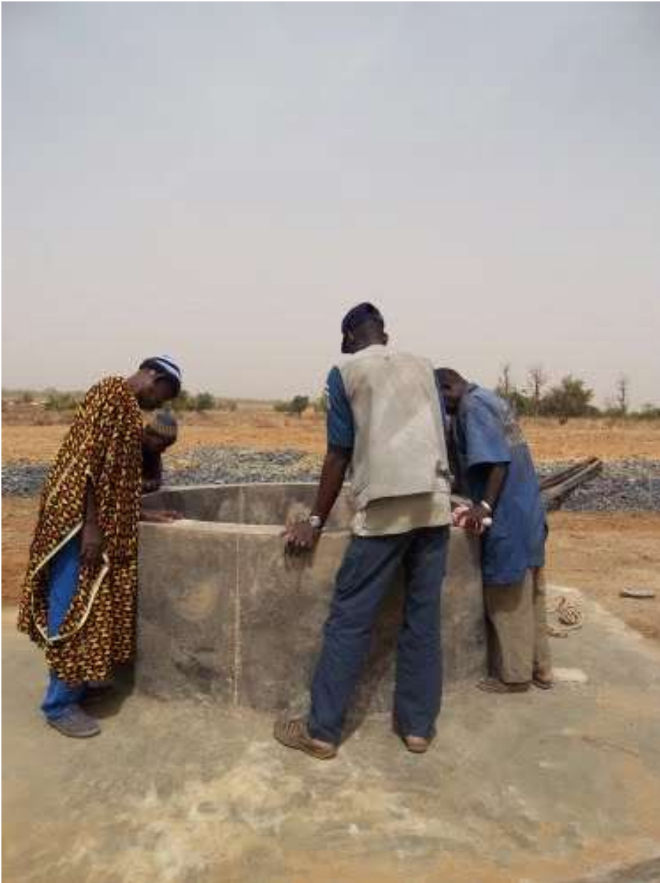
Mon village, Guémoukouraba