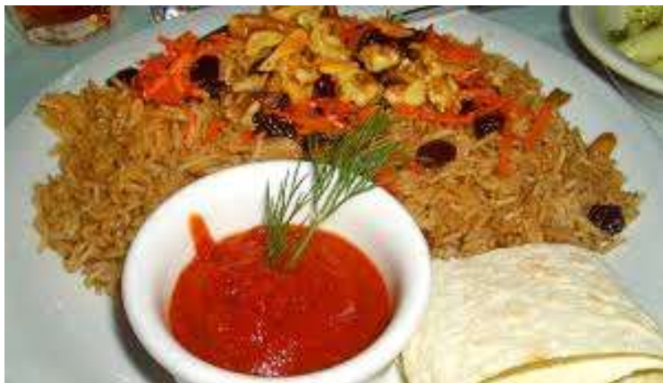
Le kabuli palaw