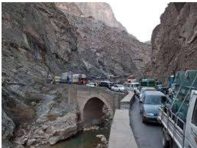
Route de Kaboul à Jallalabad